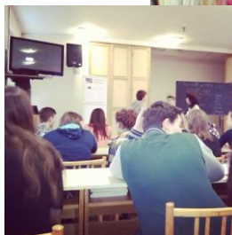
beseda: Stop kyberšikane