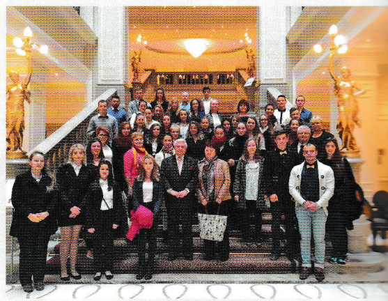
Exkurzia našich žiakov v Maďarsku

• Hotel Aquincum nesie názov po starobylom mestečku, v ktorom bol v čase rozmachu Rímskej ríše postavený vojenský tábor,